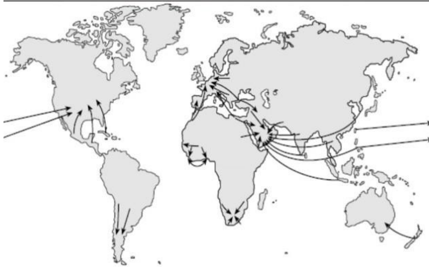
Рис.2. Основные миграционные потоки

Задание 5. Сделайте общий вывод по работе (чему учились?).